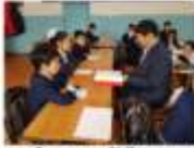
5-а сынып, Қ.Должан оқушы үніне алуға

Мугалимлар оқушылардын теориялык және практикалык алдыны, сондай-ак алардын кызыктуулуктары, ар оқушынын жеке жагына кырылып және ар істеріні қолетінін түсінуге тырысады. (Мугалимге арналган НУСҚАНЫҢ Түсінік (жетек) дерекі, 15-бет)