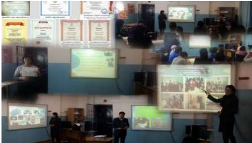
Деңгейлік курс бітірген мұғалімдердің ұжым алдындағы есеп беру сәті Сырт ұйымдармен байланыс