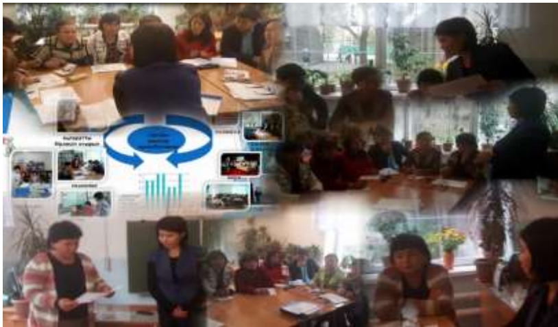
Қоғамдастық аясын кеңейту үшін отырыстан көрініс. Эдвард де Боно “6 ойлау шляпасы” арқылы кері байланыс