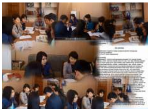
Мектеп әкімшілігі отырысы