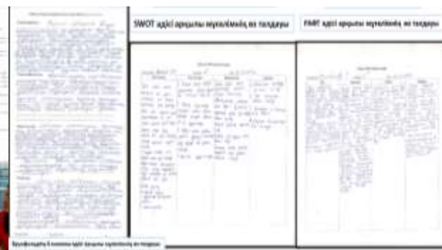
Сабақты талдау парақшалары