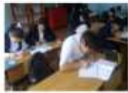
7-а сынып, М.Серіпбеков оқушы үніне алуға