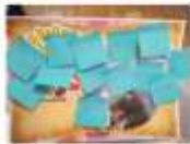
Сауалнама нәтижесі бойынша

Сәтті: білім алушылар өмір сүруге қажеттіліктерін ұғынды, А.В.С. деген облыстағы оқушылардың өз пікірлерін нақты және сөйлемді жеткізді.