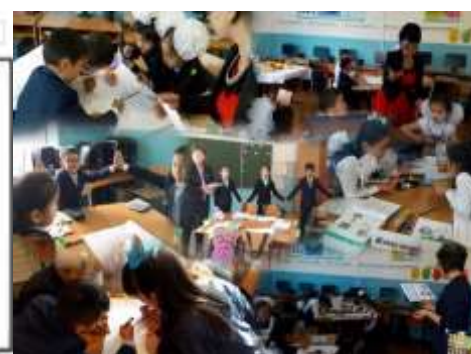
Коучингтен кейінгі сабақтар