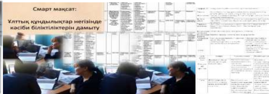
Мектеп тренерлерімен сұхбат